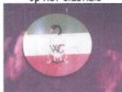
wapen Watergraafsmeer op het clubhuis

In 2001 kregen alle verenigingen ook te maken met de arbo-wet. Daar moest een coördinator voor aangesteld worden. Ondeugdelijk materiaal, machines, trappen en ander gereedschap moest afgevoerd en vernieuwd worden. De leden werden vooral in het begin regelmatig voorgelicht door de coördinator. Er moest veiliger gewerkt worden. Voor de verfraaiingscommissie zijn de nodige persoonlijke