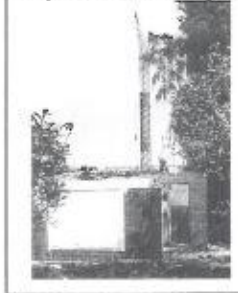
slopersbal velt huisjes

Gelukkig werden de verdreven tuinders schadeloos gesteld en konden zij op een nieuw complex in Noord weer opnieuw beginnen. Een aantal van hen zijn op ons complex gebleven, zij hadden vanzelfsprekend voorrang op de kandidaat-leden.