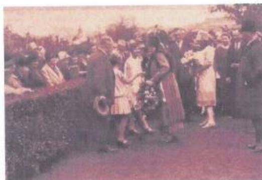
Koninklijk Bezoek aan Amsterdam. Levendige belangstelling van de Hooge Vorstelijke Gasten voor de Volkstuintjes "Ons Lustoord". H.M.de Koningin Wilhelmina, Z.K.H. Prins Hendrik en H.K.H. Prinses Juliana sloegen aandachtig en met veel genoegen het amateurtuinieren en kweken gade.