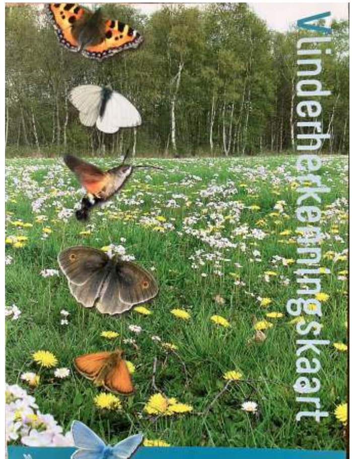
Tekst en foto's:

Probeer altijd planten te kopen die zonder gif geteeld zijn. Beter voor de plant en voor de vlinders!