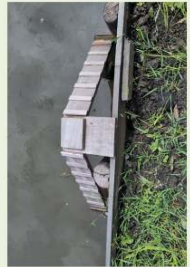
2 trappetjes op de Hortensialaan