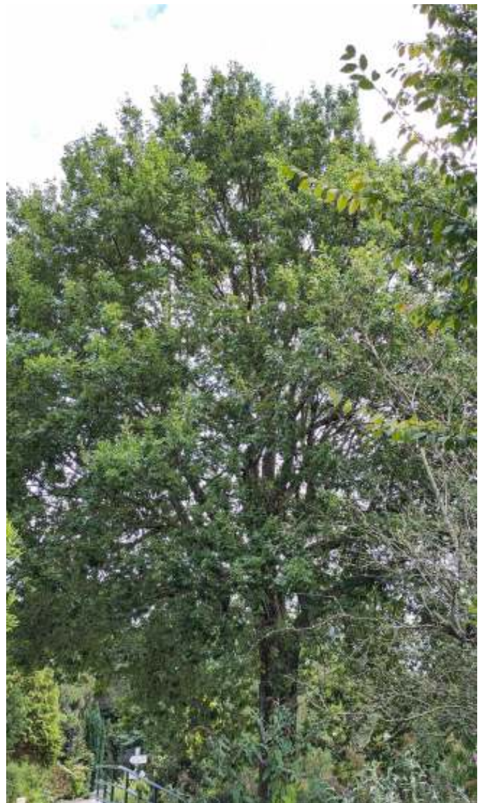
De grote eik bij het bruggetje

Op en om de eik wemelt het van beesten en beestjes. Van vogels tot vleermuizen, van dassen tot eekhoorns en vele soorten insecten. Er zijn mijten en wespen die op bladeren galappels kweken waarin hun jongen opgroeien. Er zijn luizen, wantsen en cicaden die van buitenaf sappen aan de eikenbladeren onttrekken. In het voorjaar concentreert de eik zich op een snelle ontplooiing van zijn blad. Pas later begint hij er tannine (looizuur) in te stoppen dat bij consumptie de spijsvertering verstoort. Voor de insecten is het dan ook de zaak er vroeg bij te zijn. Onder meer de kleine wintervlinder en de groene eikenbladroller doen dit. Hun rupsen vormen dan weer het stapelvoedsel voor de jongen van verschillende mezensoorten en van de bonte vliegenvanger (nog niet waargenomen op NLK).